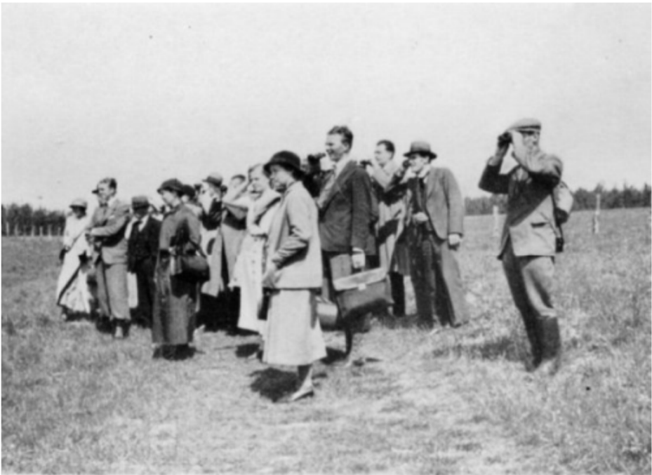
Ornitologisk Ekskursion, Nyborg. (29/5 1935.)

Et foto fra en af Naturhistorisk Forening for Fyns ornitologiske ekskursioner. Selv om påklædningen har ændret sig, er der alligevel noget bekendt over ”situationen”.